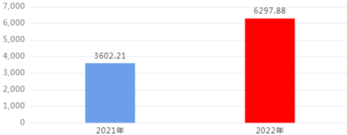
财政拨款支出对比图（单位：万元）