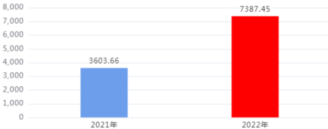
收入、支出决算总计对比图（单位：万元）

2022年度收入总计、支出总计均为7,387.45万元，与上年相比收入总计、支出总计均增加3,783.79万元，增长105%，增长的主要原因是：根据我省林业草原有害生物防治工作需要，中央和省级增加了林业草原有害生物防治能力建设等基本建设项目。